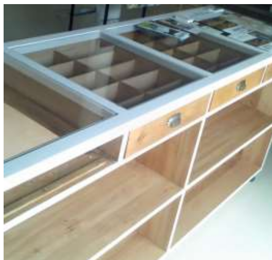
Nové vybavení NC