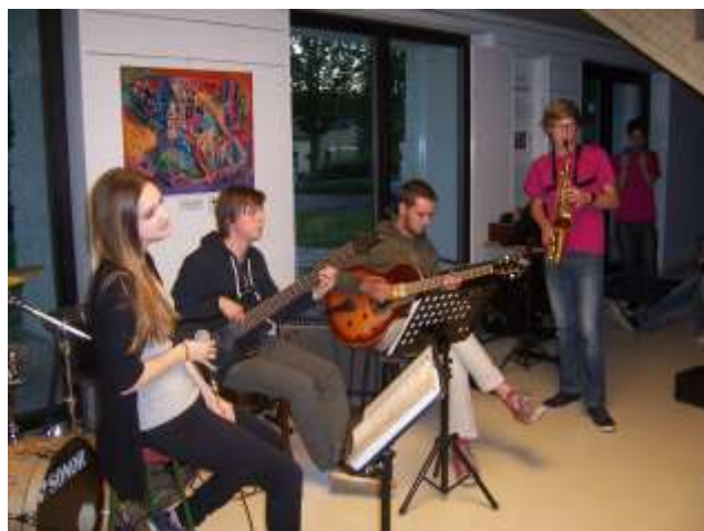
JAZZFEST – přehlídka amatérských souborů

Dle zakládací listiny je obnova a provoz bývalého kina doplňková činnost, je to ale ekonomicky největší kapitola činnosti SR, o. p. s.: