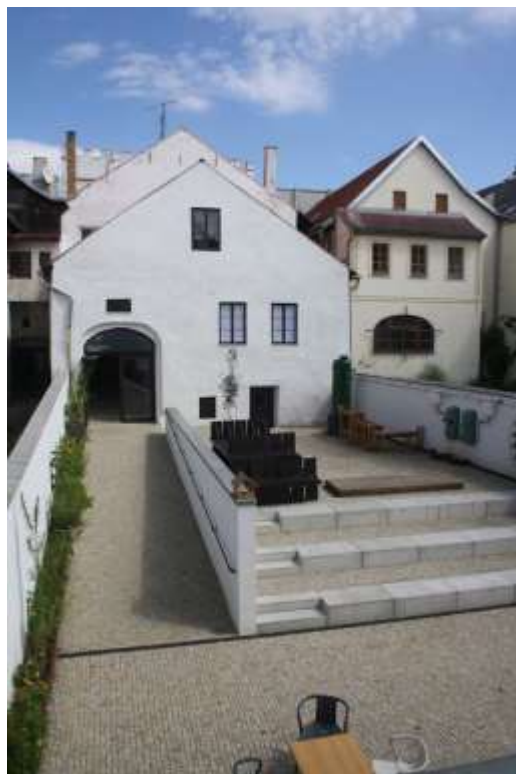
Dvůr v létě 2014

Ve Spolkovém domě proběhlo i setkání rodáků, navázali jsme kontakty pro další spolupráci – stálá expozice o historii domu, kniha o Spolkovém domě.