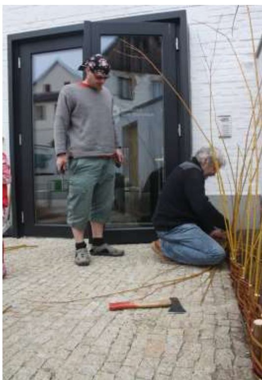
Výstavba proutěných záhonů – duben 2014