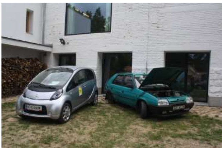
Elektroauta za Spolkovým domem, květen 2014