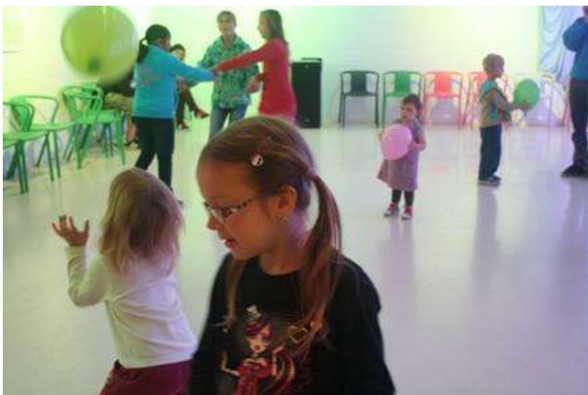
Maškarní bál Volnočasového klubu, únor 2014