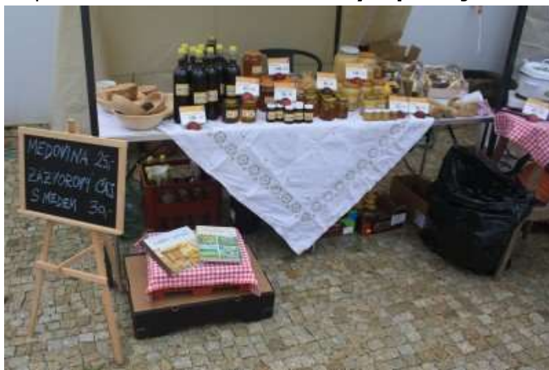
Farmářský MINI trh, říjen 2014