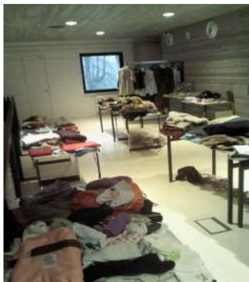
Dobročinný bazar, říjen 2014